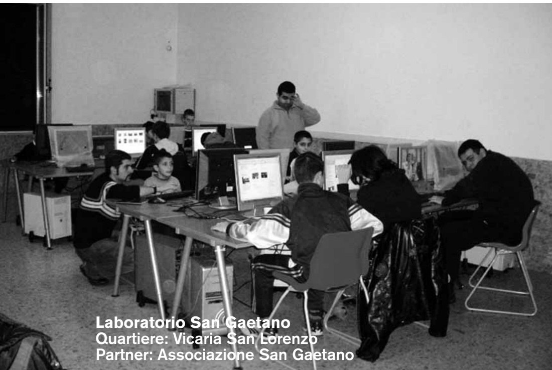
Laboratorio San Gaetano Quartiere: Vicaria San Lorenzo Partner: Associazione San Gaetano

Il progetto ha supportato l'implementazione di un Centro di Aggregazione e Formazione nel quartiere del centro storico di Napoli. Con il contributo della Fondazione è stato allestito un laboratorio di informatica grazie al quale circa 150 persone, tra minori a rischio e loro familiari, vengono supportati all'uso professionale del computer e alla navigazione sicura in internet.